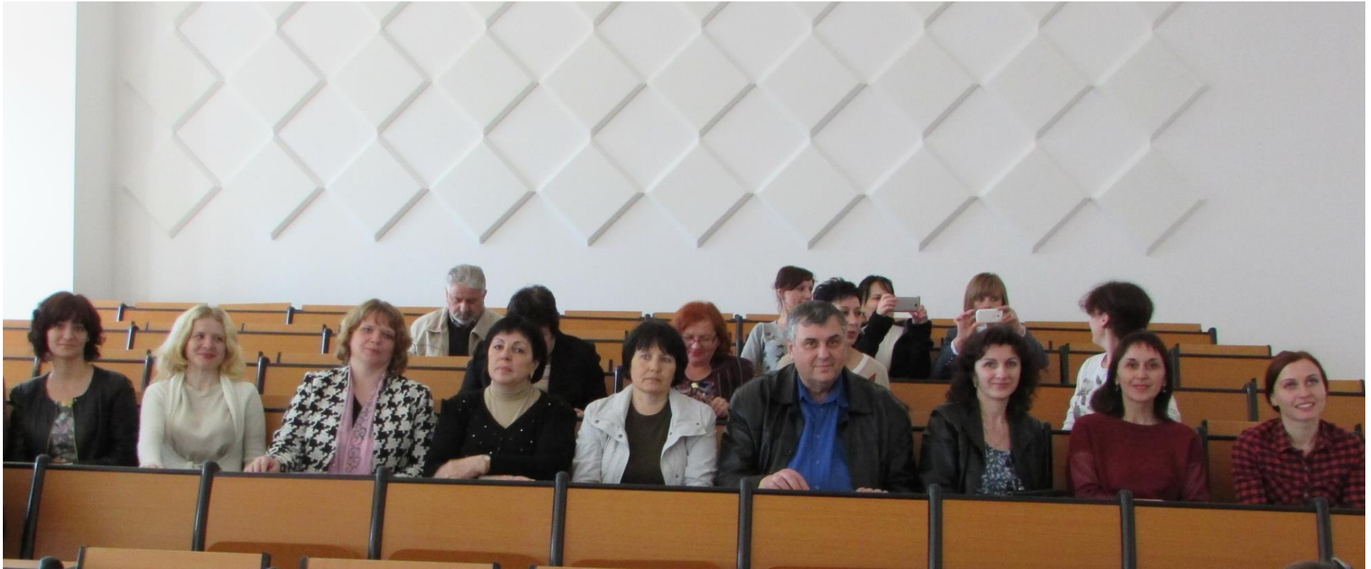
III Міжнародна науково-практична конференція «Етнос, мова та культура: минуле, сьогодні, майбутнє» (Польща, м. Люблін, Католицький університет Іоанна Павла II, 2016 рік)