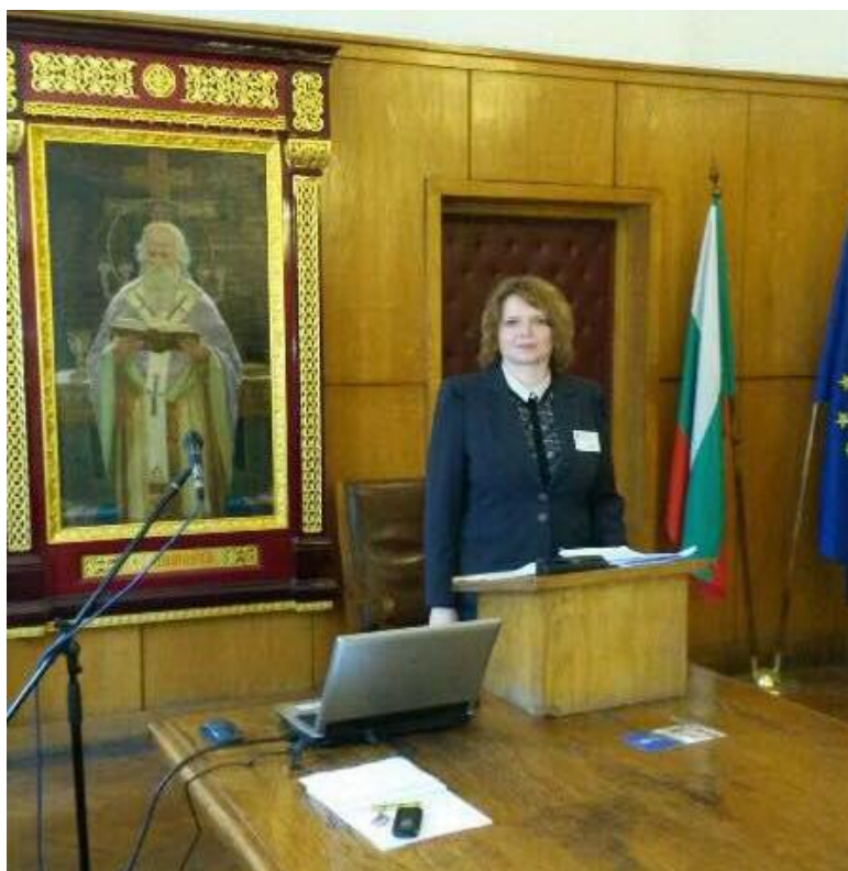
Царалунга І.Б., Тринадцяті славистичні читання на тему «Мультикультуралізм і багатомовність» (Болгарія, м. Софія, Софійський університет Св. Климента Охридського, 2016 рік)