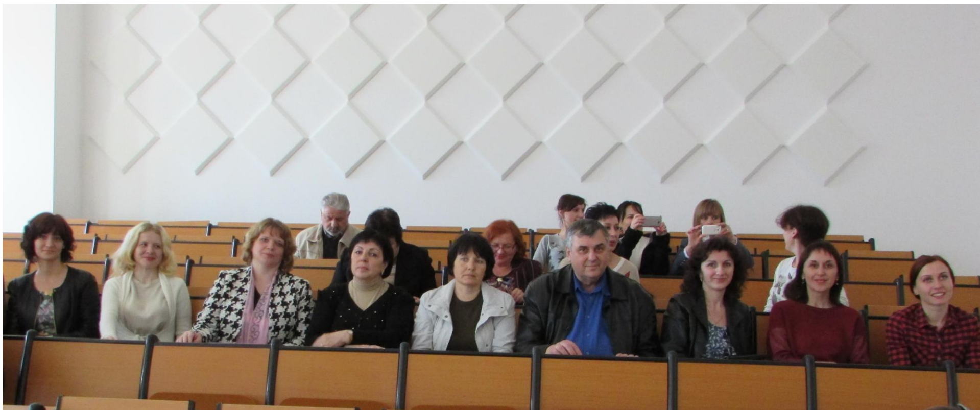
III Міжнародна науково-практична конференція «Етнос, мова та культура: минуле, сьогодення, майбутнє» (Польща, м. Люблін, Католицький університет Іоанна Павла II, 2016 рік)